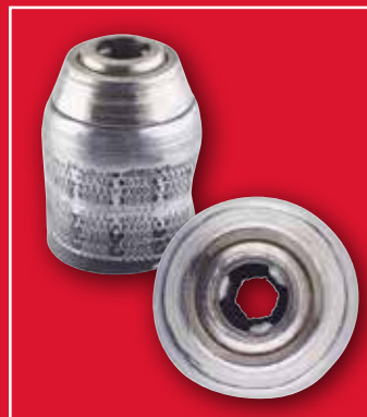
Väärinkäytön vuoksi rikkoutunut istukka