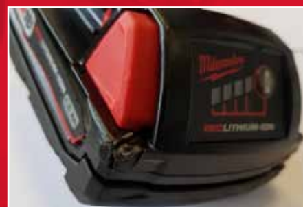
Esimerkki ulkoisesta voimasta (kova isku)