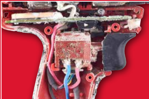
Kytintä ei voitu painaa työkaluun tunkeutuneiden roskien/lian vuoksi