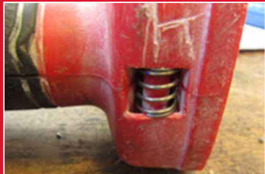
Jousi asennettu ulkopuolelle, mikä osoittaa työkalun valtuuttamattoman avaamisen