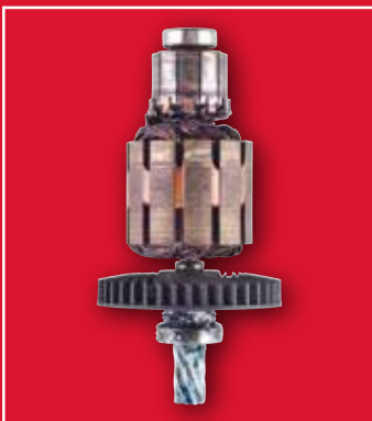
Ylikuormituksen rikkoma moottori

Huoltoliikkeen tulee arvioida kulumistapaukset.