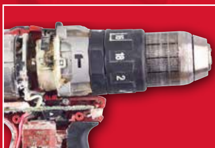
Esimerkki liiallisesta kulumisesta