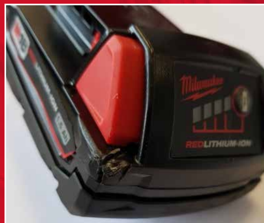
Esimerkki MILWAUKEE®-akkuun kohdistuneesta suuresta pudotuksesta tai iskusta

https://fi.milwaukeetool.eu/service/lithium-ion-batteries/